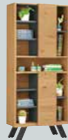
Bücherregal , mit 2 Türen, und 11 Nischen, B/H/T ca. 85x194x39 cm.