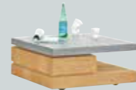
Couchtisch , mit drehbarer Platte in Betonlook, B/H/T ca. 80x36x80 cm.