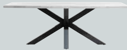
Esstisch , mit Platte in Betonlook und Gestell Metall, B/H/T ca. 160/190/220x77x100 cm.