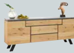
Sideboard , mit 2 Türen und 3 Schubladen, B/H/T ca. 220x90x42 cm.