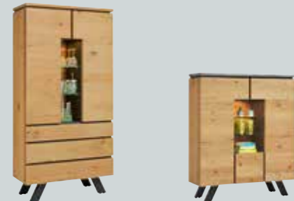
Vitrinenschrank , mit 2 Türen, 3 Schubladen und 3 Nischen, B/H/T ca. 100x196x42 cm. Inkl. LED-Beleuchtung.