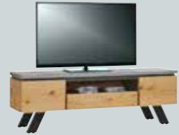
TV-Sideboard , mit 1 Schublade, 2 Türklappen und 1 Nische, B/H/T ca. 190x54x42 cm.

Dieses Programm bietet exklusive Qualität und eine zeitgemäße Optik. Klare Formen und ausgewählte Materialien finden sich hier in einem spannenden Mix wieder. Hier verwischen auch die Grenzen zwischen Speisen und Wohnen und alles kann zu einem harmonischen Ganzen gestaltet werden. Ihre Möglichkeiten für eine individuelle Anpassung finden Sie in unserem Typenplan.